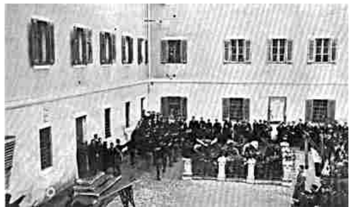
Figura 4 - Cortile piccolo della Caserma Grande di Trieste, luogo del supplizio

Gli ufficiali del reggimento Arciduca Alberto, che doveva presenziare l'esecuzione, chiesero telegraficamente all'imperatore la grazia. Non ebbero alcuna risposta, e alle 6 si fece vestire a Guglielmo, l'assisa del reggimento Weber; venne visitato dal medico militare e dal cappellano, ma avendogli mandato i suoi carnefici un prete slavo, e non un italiano, egli, contro la sua volontà, rifiutò i sacramenti.