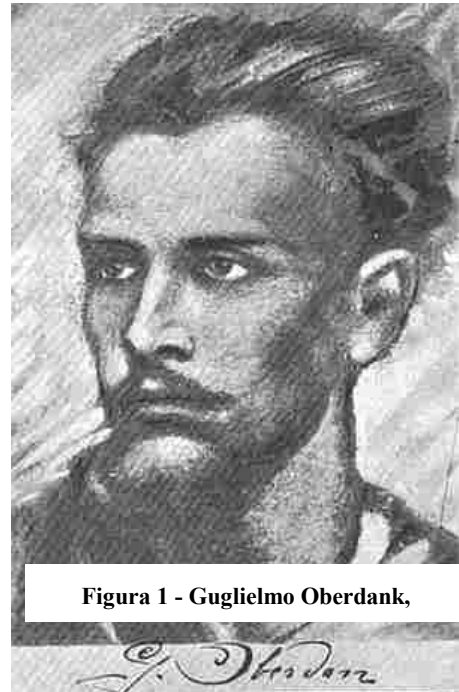
Figura 1 - Guglielmo Oberdank,

Il patrigno, un capofacchino al molo, non volle riconoscerlo, perché lo considerava figlio della colpa, e lo trattava anche poco amorevolmente, tanto che questi a sette anni tentò una fuga dalla casa paterna. Cresceva magro e gracile, così che a prima vista pareva incapace di un qualsiasi esercizio fisico, e volle divenire forte, frequentando con pazienza e tenacia incrollabile la palestra ginnastica.